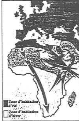
À la fin de l'été, coucous, martinets, rouge-queues, fauvettes, alouettes, hirondelles... partent pour l'Afrique. Ces oiseaux terrestres suivent le plus possible un itinéraire au-dessus des terres.