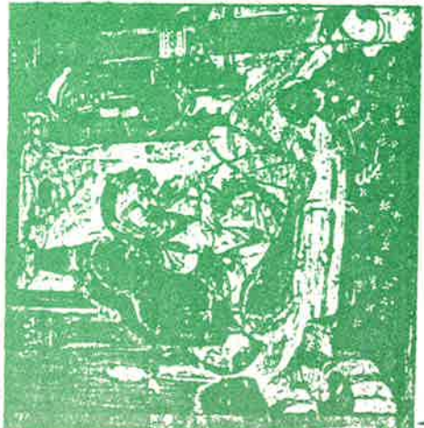
19. Couple princier (Ajanta, Inde).