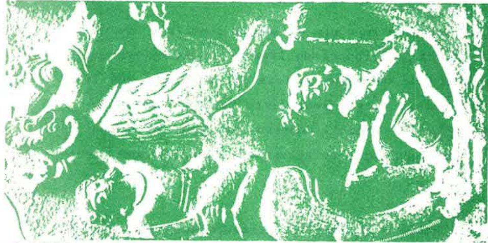
20. Deux Kshatriyas (Sarnath, Inde).

AL-BIRUNI, Description de l'Inde, vers 1000.